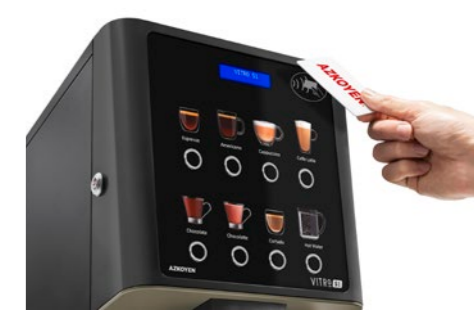
Kit RFID-Lesegerät Für Produktladekarten oder bargeldlose Systeme.